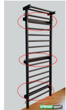
Négyszögletes cső a fém

Mindkét változat ellenálló inkább ízlés kérdése vagy maga a fal amelyre lesz szerelve.