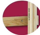
placa de madera