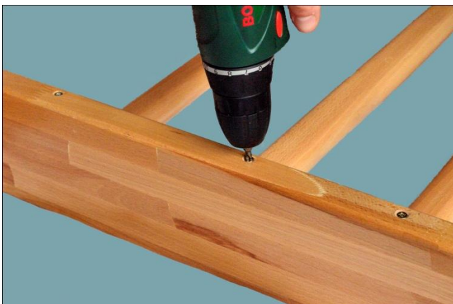
5. Maak aan de achterkant van de zijpanelen de sporten vast met boormachine dit kan met een schroeven