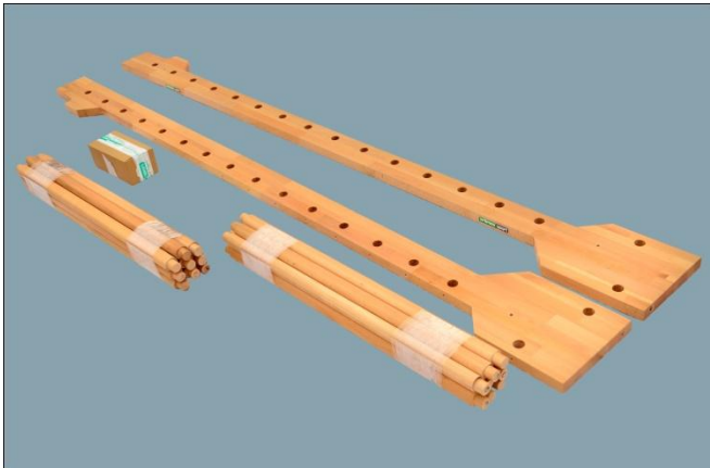
1. In het packet aanwezig