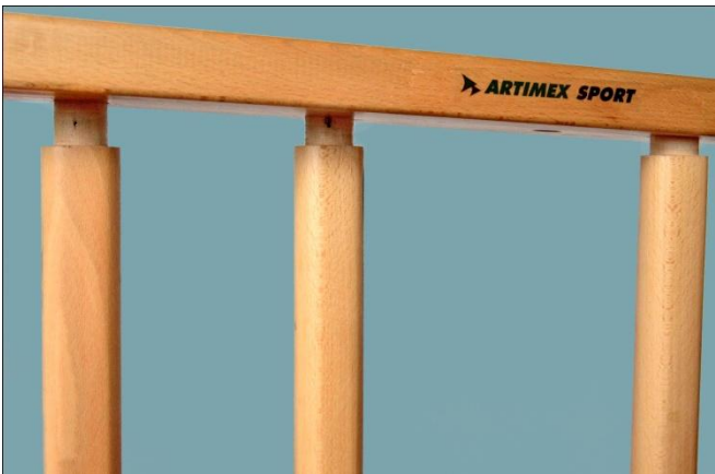
3. Bevestig het tweede zijpaneel aan de andere zijde van de sporten