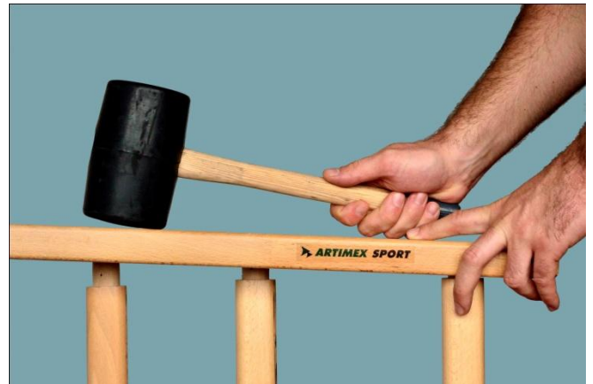
4. Om de zijden te beschermen gebruikt u een houten blok om tussen de zijden en uw rubberse hamer te houden zodat u de sporten verder kunt vastslaan