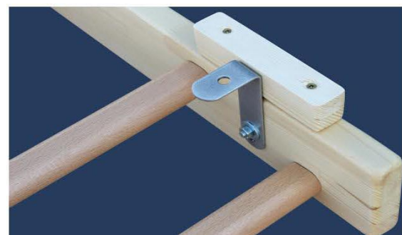
6. 金属スペーサをつける。内側と外側両方につけられるのです。