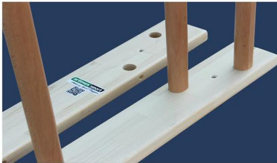
3. 2番目のレールを合わせる。片端から作業を開始、横木を一本ずつ差し込む。