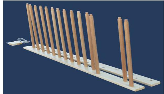
2. サイドレールに次から次へと横木を差し込む。完全に埋め込むために必要な場合、ゴムハンマーで叩く。