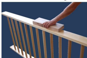
4. Per le barre laterelli per il modo sicuro faggio si prega di utilizzare un pezzo di legno e un martello di goma.