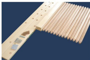
1. Il pacheto include