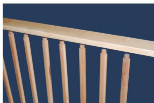
3. Fissate secondo lato