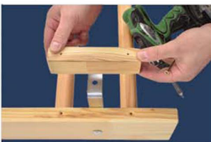
6. Prendeti i 4 angoli di metallo hai lati dello spalliera.