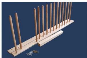
2. Metere le bare dello spalliero nella prima laterale. Se necessario uzate un martello di gomma.