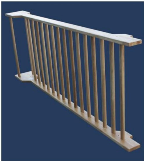
3. Fixer les barreaux au dos de l'espalier avec de vis.