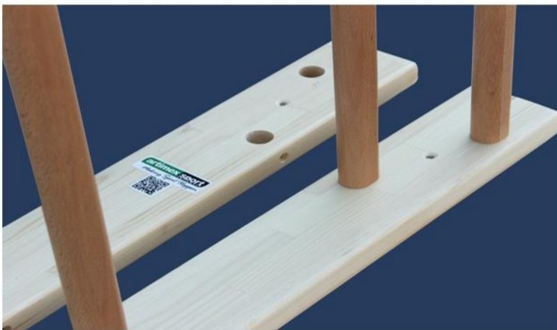
3. Firar las barras también en el otro lateral.