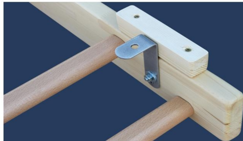
6. Fijar la tabla/ separadores de montaje en la parte trasera con los tornillos (no de todos modelos).