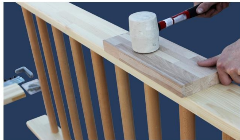
4. Para proteger la tabla en la pared, usar una pieza de madera y el martillo de goma para insertar los palos completamente dentro de los paneles.