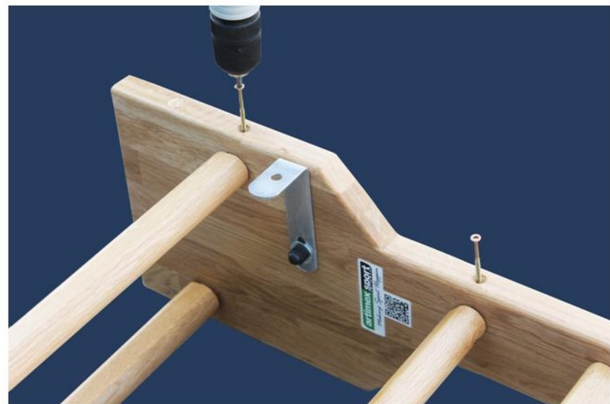
4. Fijar las barras por el lado trasero del lateral que se colocara en la pared, utilizando los tornillos.